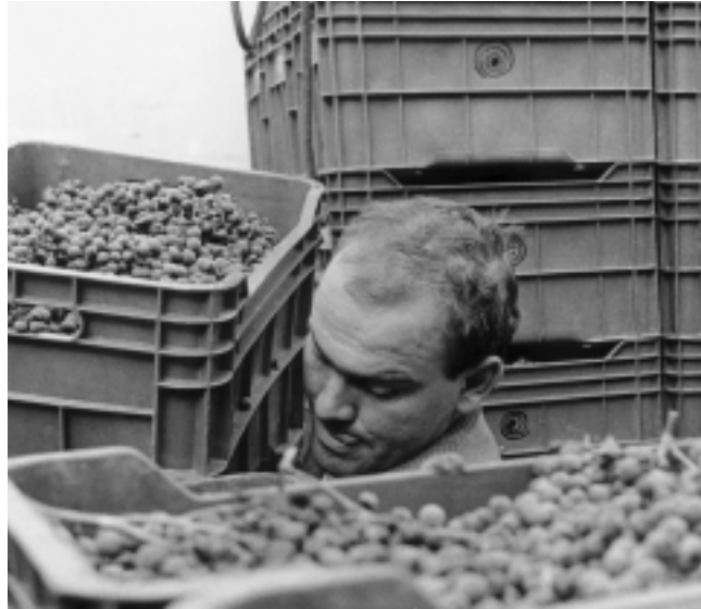
Un millésime qui fera sûrement figure de champion dans les annales.