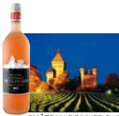
CHÂTEAU DE VUFFLENS