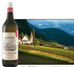
CHÂTEAU MAISON BLANCHE

«Clos, Domaines & Châteaux», c'est l'Association de quelques-uns des plus beaux domaines viticoles suisses, unis afin de mieux faire connaître les vins de leur propriété sous un label de qualité unique et reconnaissable par une BANDEROLE ROUGE ET ARGENT . Liés par une Charte et un règlement plus sévère que la législation des «Appellations d'Origine Contrôlées», leur but est d'offrir des crus d'exception, reflets de leur terroir et de leur patrimoine historique.