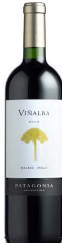
VINÁLBA MALBEC SYRAH Red Wine Of Argentina Domaine Vistalba Patagonia, Argentina