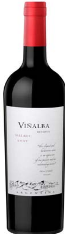
VINÁLBA MALBEC RESERVA Red Wine Of Argentina Domaine Vistalba Mendoza, Argentina